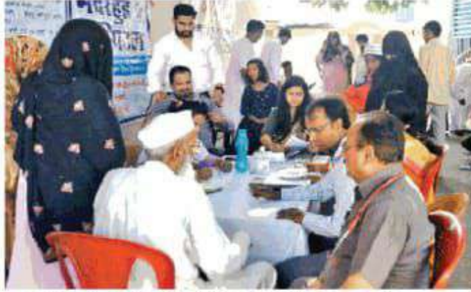
मदरहुडखिवि की ओर से आयोजित चिकित्सा शिविर में जांच करते लोग

निगम न पड़ाव स्थित अप पैमाइश करई है। पैमाइश के अब मल्टी स्टोरी पार्किंग के नक्शा तैयार करने जा रहा नगर आयुक्त चंद्रकांत भट्ट। निगम पड़ाव में मल्टी स्टोरी तैयारी कर रहा है। इस पार् जाने से मेन बाजार में जाम काफी हद तक दूर हो जाएगा