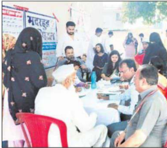
रुड़की : शिविर में रोगियों की जांच करते चिकित्सक।